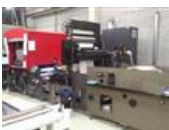
Referenční číslo: 17122 AGFA DOTRIX MODULAR Digitální tiskový stroj