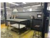
Referenční číslo: 24035 DURST RHO P10 200 Digitální tiskový stroj