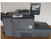
Referenční číslo: 17046 KONICA MINOLTA BIZHUB PRO C 5500 Digitální tiskový stroj