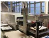
Referenční číslo: 22038 SPS VITESSA XP 2 + AEROTERM Sítotiskový stroj