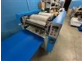
Referenční číslo: 25038 PASEN PCY - 2 Flexotiskový stroj