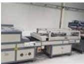
Referenční číslo: 24017 3/4 AUTOMATIC SCREEN PRESS Sítotiskový stroj