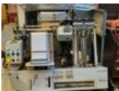
Referenční číslo: 22039 GRAFOPRESS GPF Knihtiskový stroj