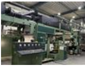
Referenční číslo: 25030 LEMOFLEX CI 642 Flexotiskový stroj